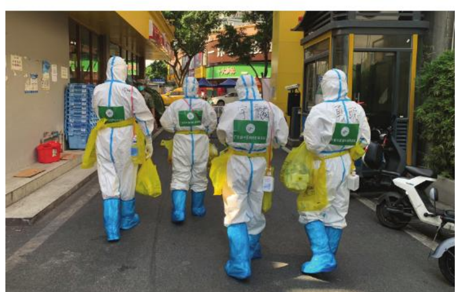
核酸突击队赴高风险区上门核酸采样