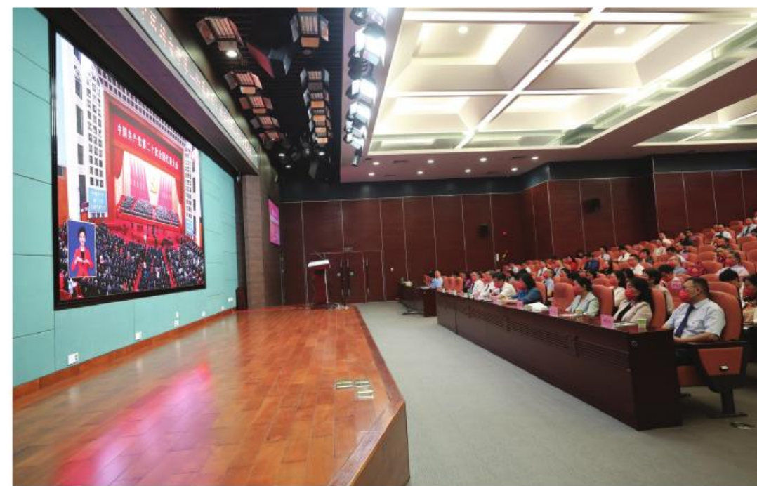
医院党委组织党员干部集中收看党的二十大开幕