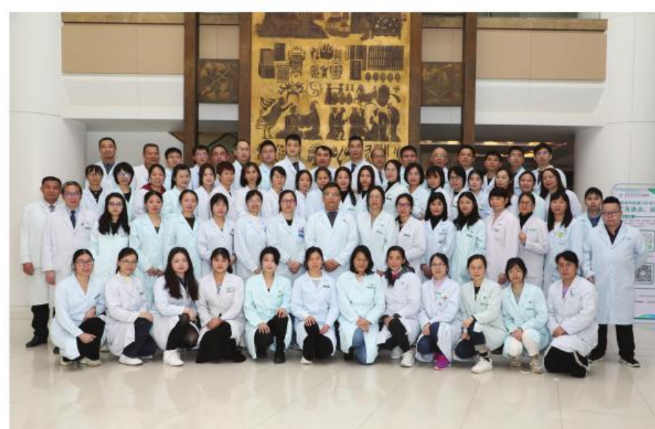
最佳集体: 珠海医院药剂科

作为珠海医院最大的辅助科室,他们始终秉承为促进临床合理用药提供服务的理念,不断强化服务意识,提升临床药学服务能力,曾获放心药房、优质服务窗口等称号。2022年在疫情防控关键时刻,他们不畏艰辛,加班加点,全年调剂中药抗疫处方近20万剂,为中医抗疫作出突出贡献,受到百姓高度认可。