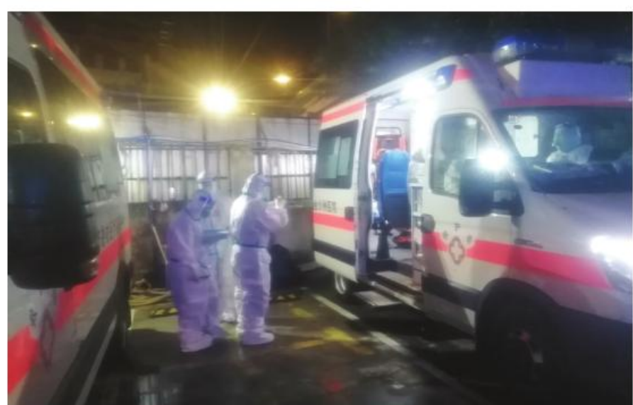
核阳转运专班昼夜不停转运患者