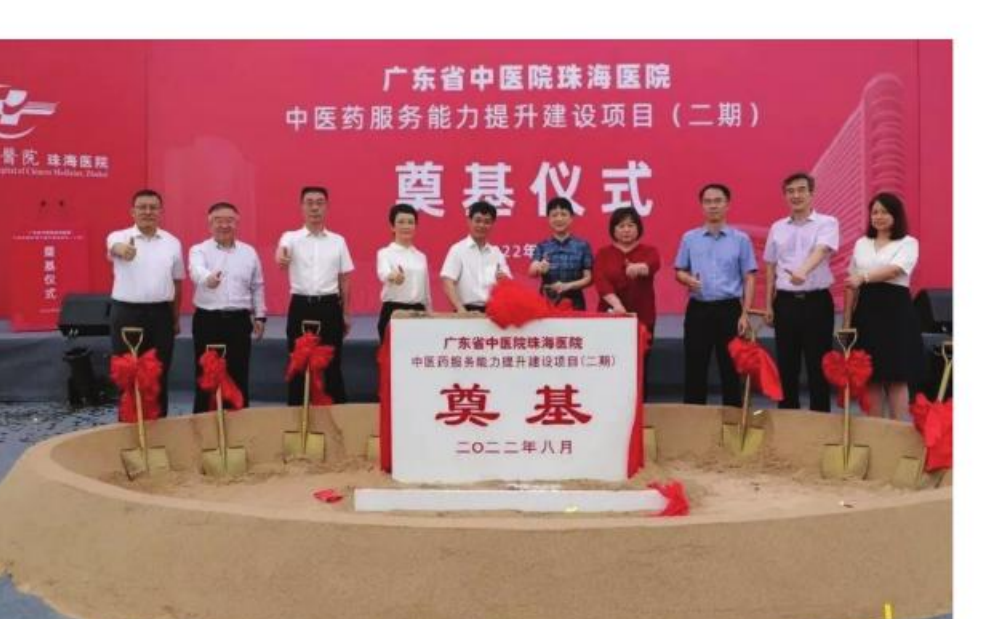
广东省中医院珠海医院中医药服务能力提升建设项目二期奠基