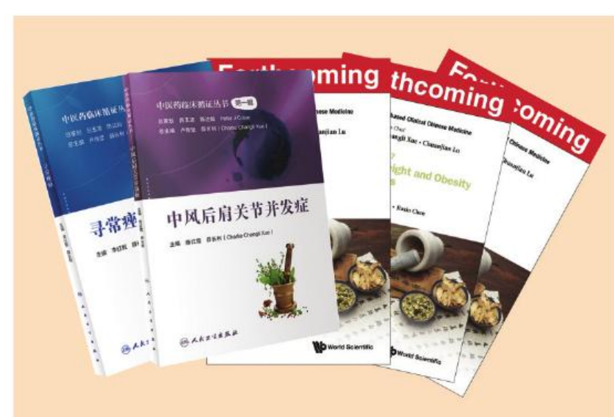
中澳国际中医药研究中心出版证丛书