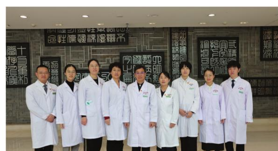
最佳集体:中医药防治热病研究团队

承担四院区主要核酸检测工作,近一年完成200余万人次核酸检测量;2022年在全球范围内首次命名了3个细菌新种;中标国家自然科学基金青年项目1项,省部级课题4项,获发明专利1项,共主持含11项国家自然科学基金在内的课题60多项;主编专著1部,参编2部。