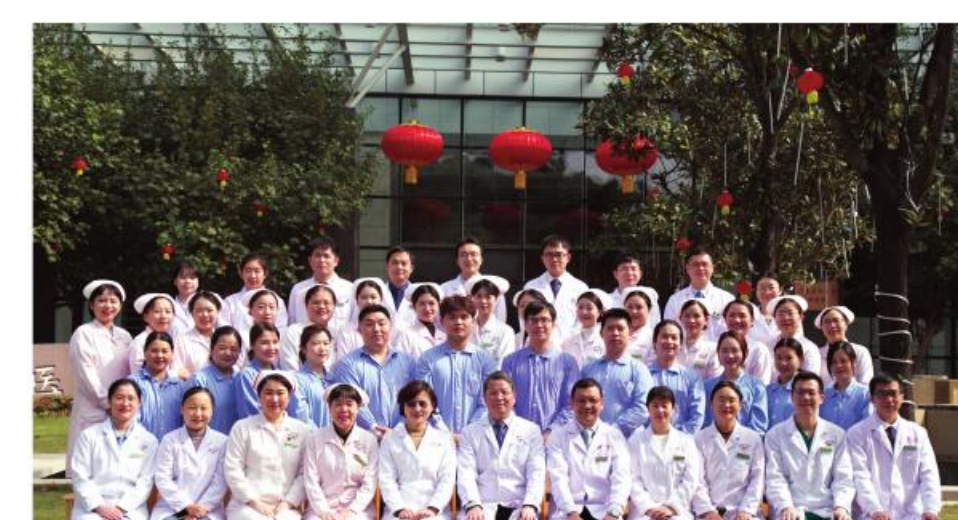
最佳集体:大学城医院脾胃病科

成功通过国家胸痛中心认证;大力推广中医中药在院前急救中的运用;作为全国中医急诊专科医联体副主席单位,积极参与构建“岭南急诊联盟”,有效提升基层医院急救能力;积极承担抗疫任务,多次派出骨干力量支援省内外抗疫工作。