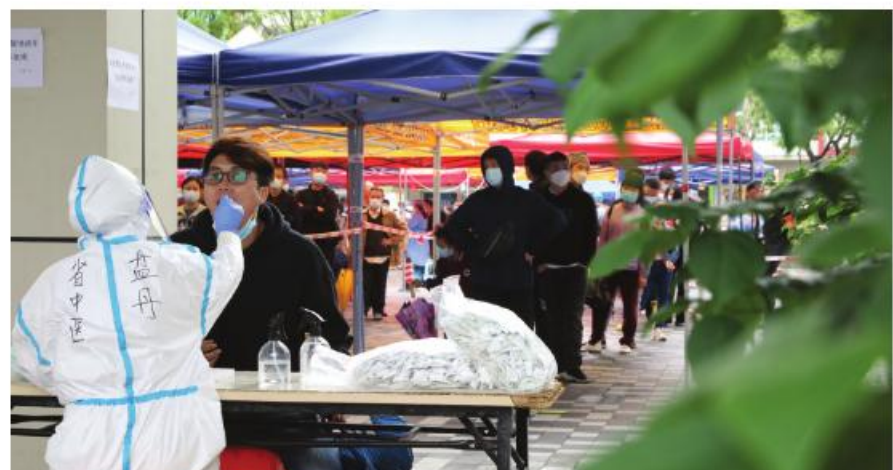
我院医疗队支援广州大规模核酸采样