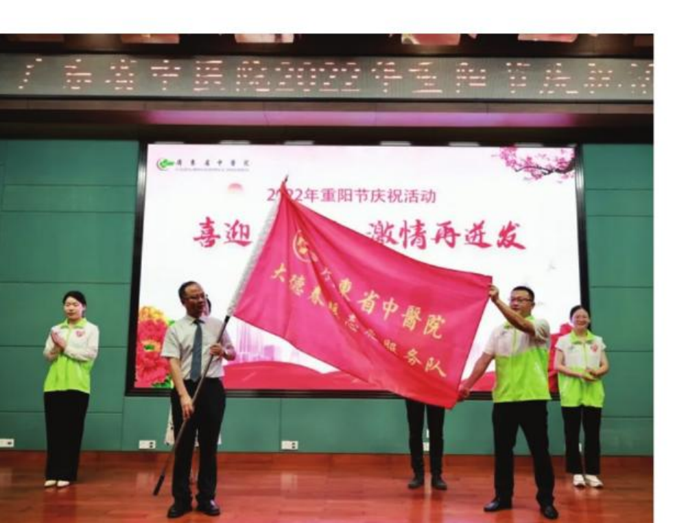
医院成立“大德春暖”青年志愿服务队