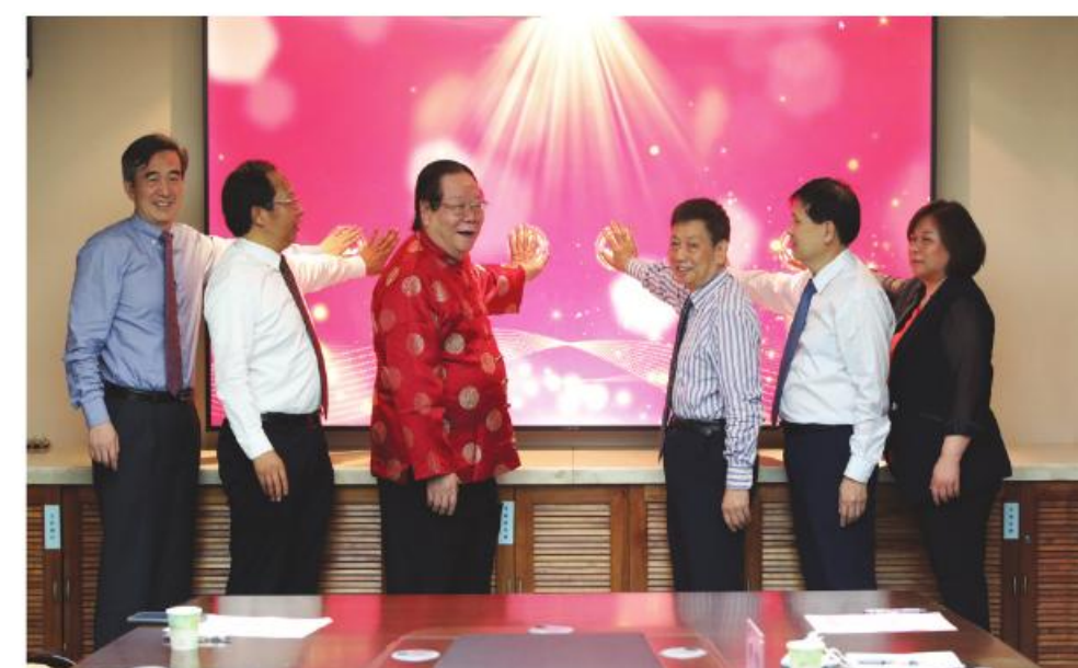
国医大师周岱翰教授在我院带徒并成立学术经验传承工作室