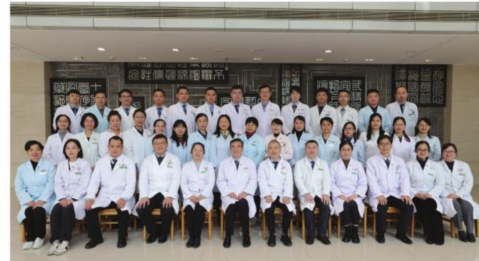
最佳集体:医务处(会病室、统计室)、医疗质量控制办公室、对外合作办公室、器官移植管理办公室

科室专科建设稳健发展,年度出院病人1700余人;开展多项高难度内镜下新技术,内镜诊治量年度愈2.6万人次;主持在研课题13项,研究经费累计1000余万,新增省中医药局课题2项,市校(院)联合资助项目1项,获得实用新型专利1项。