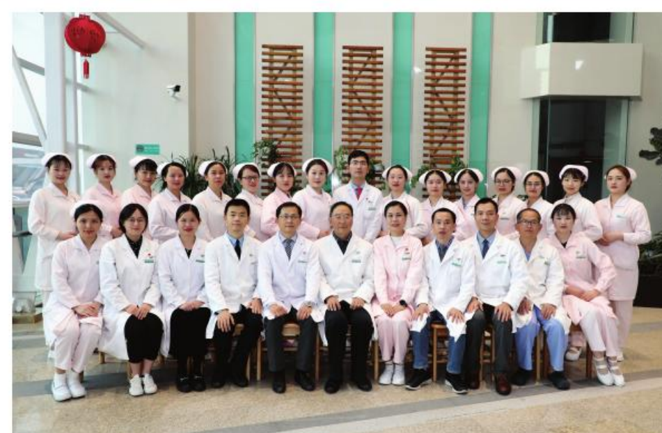
最佳集体: 珠海医院脾胃病科

作为珠海医院最大的辅助科室,他们始终秉承为促进临床合理用药提供服务的理念,不断强化服务意识,提升临床药学服务能力,曾获放心药房、优质服务窗口等称号。2022年在疫情防控关键时刻,他们不畏艰辛,加班加点,全年调剂中药抗疫处方近20万剂,为中医抗疫作出突出贡献,受到百姓高度认可。