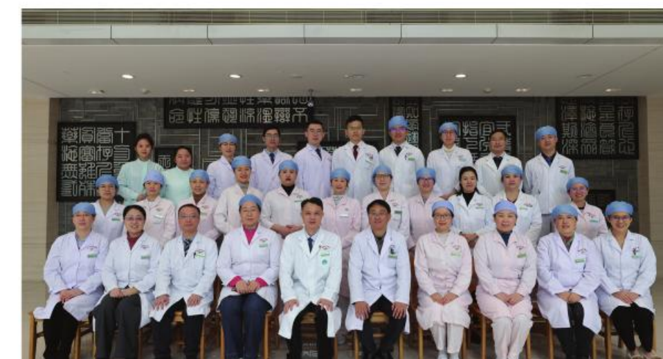
最佳集体:大德路总院肾内科

年急诊服务量10万人次,发热门诊接诊近4万人次,120出车数量等较去年增加超10%。国家区域诊疗中心内涵建设进一步加强,急危重症救治中心通过国家复评;引领全国中医急诊学科发展,打造一流疫病救治团队。疫情攻坚时期,团队克服重重困难,救治急危重症患者。新增国家自然科学基金6项,主持参编指南6部,出版教材专著5部,《急救在身边》获省一流本科课程。