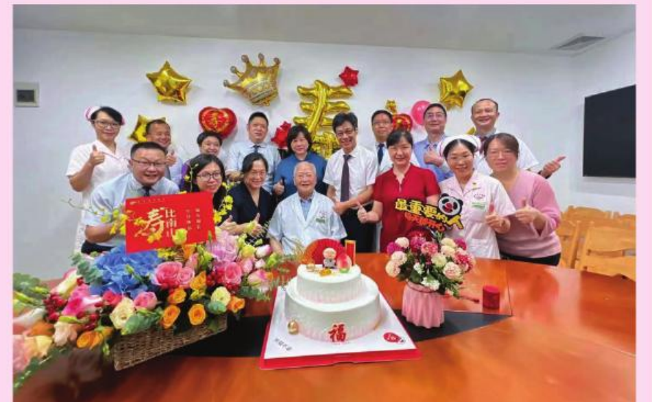
幸福省中医,欢乐一家人。医院党委向老专家祝寿