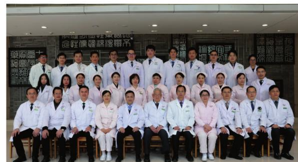
最佳集体:大德路总院骨伤一科

牵头申报国家医学中心,起草公立中医医院高质量发展试点工作方案,在省内首次建成中医紧急医学救援国家队,牵头协助省医保局构建中医特色医保支付体系。组织374人进驻琶洲方舱医院,共救治近6200人;派出132批驰援核酸采集和5支核酸突击队,共采样665.1万份;派出6批支援核辐射转运专班和51名专家外出抗疫;派出260余人次支援社区疫苗接种,组织培训369人获得疫苗接种合格证。