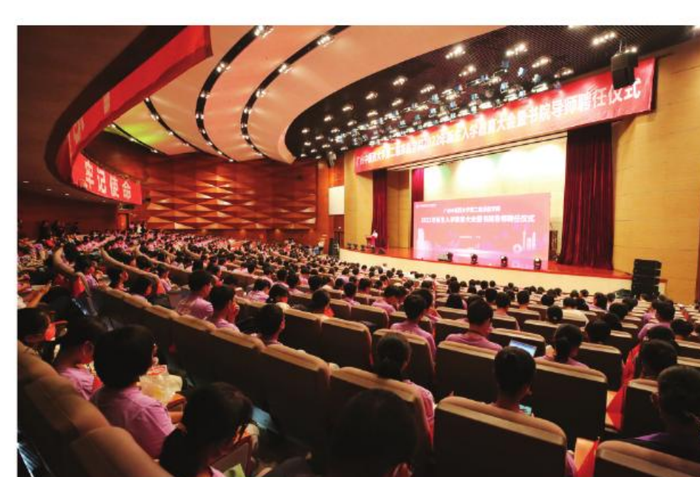
广州中医药大学第二临床医学院召开新生入学教育大会