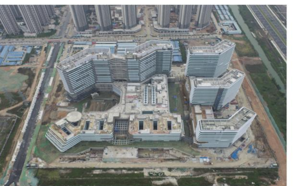
广东省中医院南沙医院项目稳步推进

对外科研合作持续拓展。中澳国际中医药研究中心出版循证丛书英文版4部、中文版2部,中瑞中医药联合研究基地建立521种活性提取物和60余种纯化合物数据库,与荷兰乌特勒支大学合作引进单细胞质谱流式技术应用于免疫疾病。与国家蛋白质研究中心合作,首次发现血清蛋白复合带型可用于提示发现和质的虚实体质转化倾向;利用尿液蛋白质组发现重症COVID-19预警蛋白和潜在的治疗靶点并发表SCI论文(IF=10.37)。与生物芯片上海国家工程研究中心联合制定《人类粪便样本采集与处理》(GBT 41908—2022)、《洗涤剂菌质量控制和菌落样本分级》(GBT 41901—2022)等2项国家标准获发布,医院协同创新迈出新步伐。