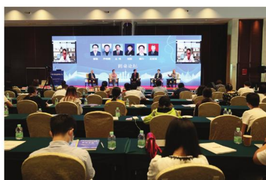
中医证高峰论坛在广州举行