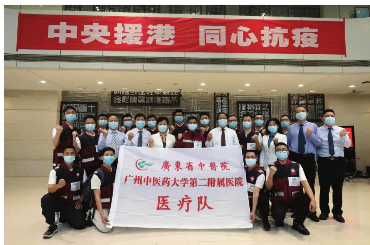
我院援港医疗队出发