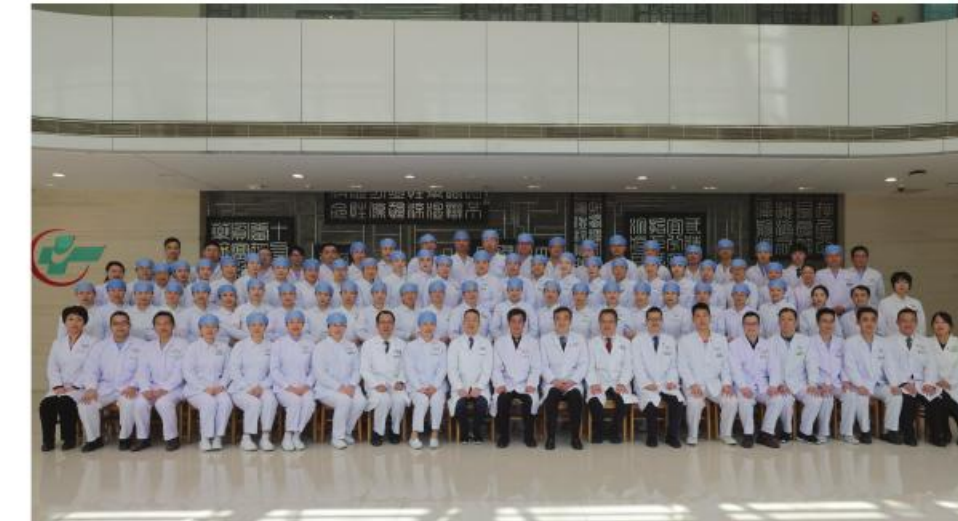
最佳集体:大德路总院急诊科

年急诊服务量10万人次,发热门诊接诊近4万人次,120出车数量等较去年增加超10%。国家区域诊疗中心内涵建设进一步加强,急危重症救治中心通过国家复评;引领全国中医急诊学科发展,打造一流疫病救治团队。疫情攻坚时期,团队克服重重困难,救治急危重症患者。新增国家自然科学基金6项,主持参编指南6部,出版教材专著5部,《急救在身边》获省一流本科课程。