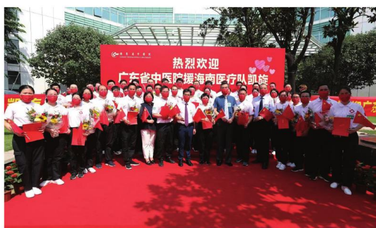
我院援海南医疗队凯旋