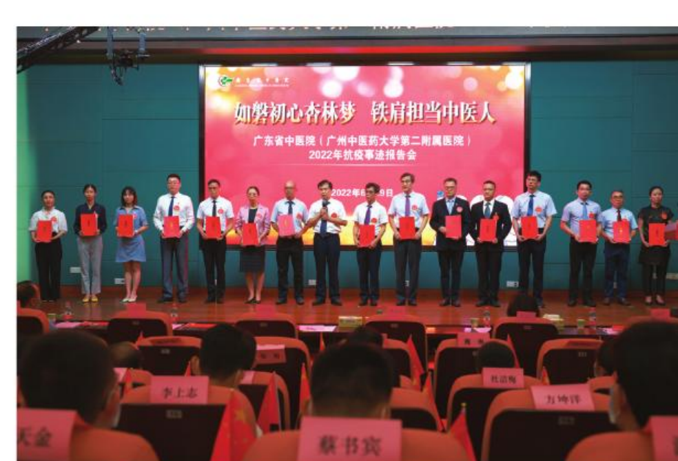
医院召开抗疫事迹报告会