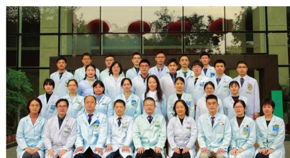
最佳集体:大学城医院检验科

作为我省最早成立的心衰病区,专科开展多项先进的中西医结合诊疗技术,填补院内乃至省内技术空白;发扬创新陈可冀院士“阴阳并调,动静结合”的心衰干预理论,与瑞典卡罗林斯卡医学院等国内外医药院所联合开展研究,成果丰硕。