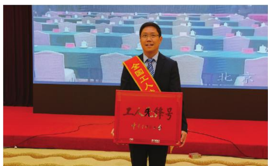
心血管病中心获评“全国工人先锋号”