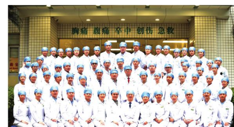
最佳集体:芳村医院急诊科

作为PCCM优秀单位、国家区域(华南)中医肺病诊疗中心,牵头成立中国呼吸专科医联体中西医协作组华南中心,连续多年获得中国中医医院最佳研究型专科;在研国家自然科学基金3项,临床研究14项,在研经费超过1000万,并获批院内制剂。