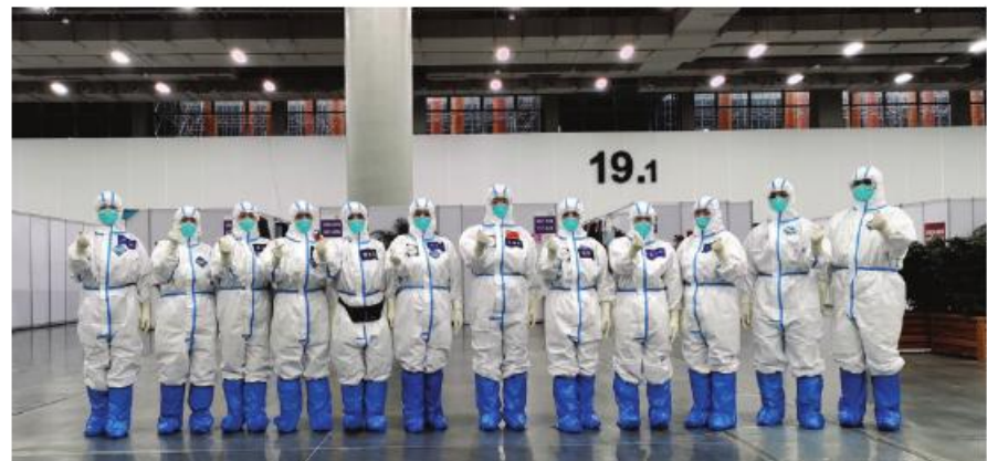
我院医疗队进驻琶洲方舱医院,整建制接管D19舱