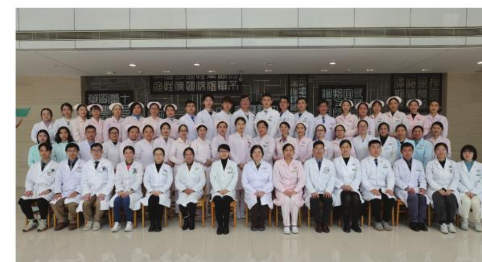
最佳集体:大德路总院呼吸病科(PCCM)

再次获评特级科室,重症救治率逐年递增,牵头制定首个大湾区肾病管理标准;连续4年获评全国中医医院最佳研究型专科;近三年新增国家自然科学基金项目5项,新增课题19项,发表SCI论文19篇,《自然》子刊论文1篇,单篇影响因子42分;5人入选青苗及拔尖等人才培养项目。